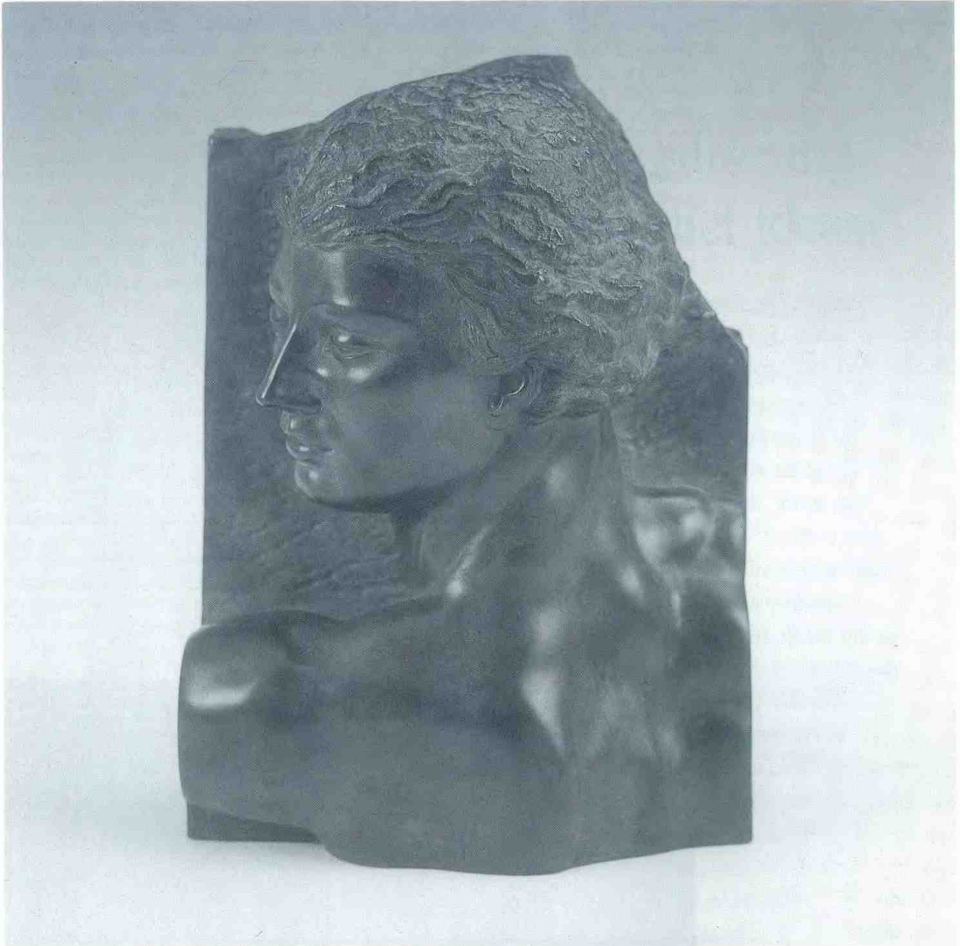
'Hodegretia', 1992, brons. 20 x 11 x 27 cm hoog.

andere levensvormen en stelt hem in staat idealen na te streven. Bij zijn streven naar verwezenlijking van zijn ideaal moet de mens tot het uiterste gaan en daarvan de consequenties aanvaarden. Tegelijkertijd echter blijft het ideaal ongeschonden, omdat het anders geen ideaal meer is.